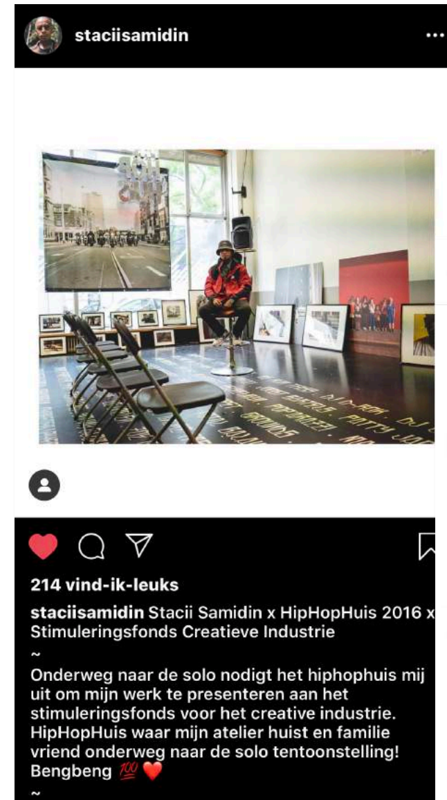
brianelstak Stedelijk Museum Bureau Amsterdam