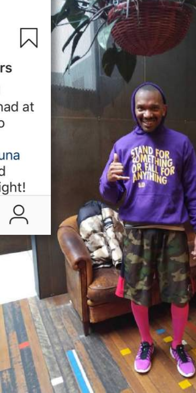
Liked by hiphophuis and edsonsabajo Great turn up at every week Sunday run with